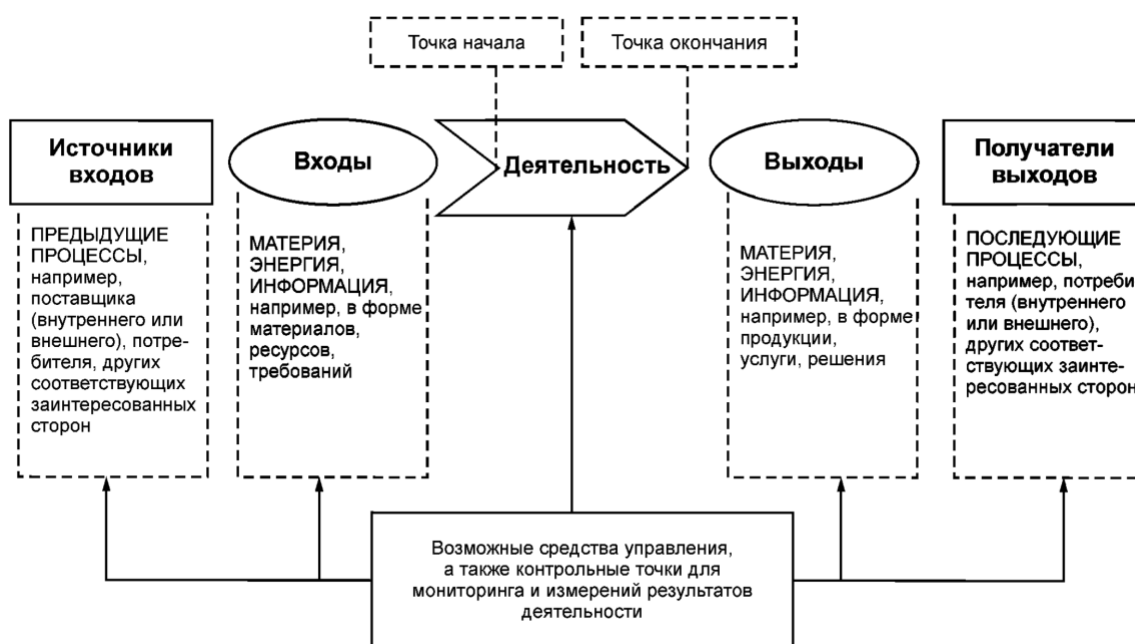
Рисунок 1 дает схематичное изображение любого процесса и иллюстрирует взаимосвязь элементов процесса. Контрольные точки мониторинга и измерения, необходимые для управления, являются специфическими для каждого процесса и будут варьироваться в зависимости от соответствующих рисков.